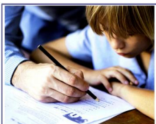
COLLÈGE PIERRE-JEAN DE BÉRANGER