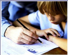
COLLÈGE PIERRE-JEAN DE BÉRANGER